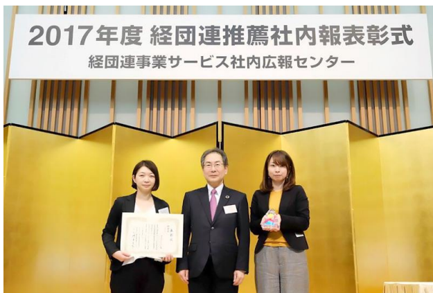
「ミルコミ」が雑誌・新聞部門において総合賞を受賞

株式会社マクロミル（本社：東京都港区、代表執行役 グローバル CEO：スコット・アーンスト 以下、当社）の社内報「ミルコミ」が、一般社団法人 経団連事業サービス 社内広報センターが主催する 2017 年度 経団連推薦社内報審査※の雑誌・新聞部門において「総合賞」を、Web 社内報「NOW」がイントラネット部門で「総合賞」に選出されました。2017 年度、両部門での受賞は、選出企業の中で唯一であり、「NOW」は 2 年連続、「ミルコミ」は初の受賞となりました。