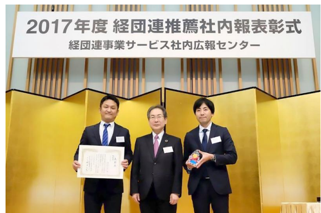
「NOW」がイントラネット部門において総合賞を受賞

当社では、紙と Web それぞれの特長を使い分けながら、最適な情報伝達を行っています。社内メディアの充実に加え、各種取り組みの実施など積極的なインテナルコミュニケーションを展開し、“組織の実行力を高める”ことを目指しています。