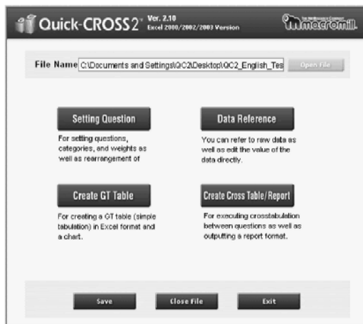
英語版 [Quick-CROSS2] メニュー画面